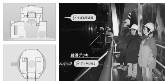
図5 展望デッキからすばる望遠鏡を眺めながらガイドの説明を受けます。