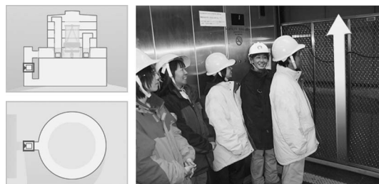
図4 ヘルメットを着用後エレベータで観測階まで昇ります。