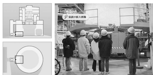
図6 再びドーム1階に戻って主鏡のメッキ・洗浄装置の説明を受けます。

学の所要時間は約30分です(詳しくは「すばる望遠鏡ドーム内見学ヴァーチャルツアー」 http://www.naoj.org/Information/Tour/VTour/j-index.html をご覧ください)。