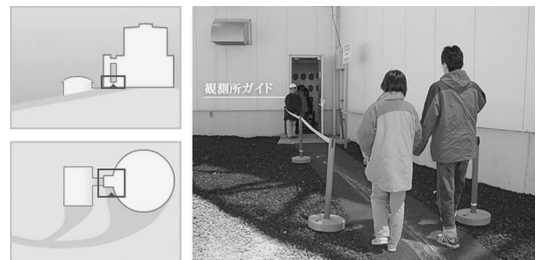
図 3 ドーム下の外部エレベータ入り口で観測ガイドがお迎えます。

えられ（図 3）、安全のためヘルメット着用後エレベータを使って（図 4）観測階の入り口からドーム内に入り、さらに別のエレベータで展望デッキまで昇ります。ここで望遠鏡本体を眺めながらガイドの解説を聞きます（図 5）。そして、来た順路を逆にたどって地上階に戻り、ドーム 1 階で主鏡のメッキ・洗浄装置の説明を受けます（図 6）。見