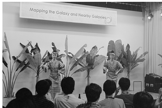
写真8 バンケット会場・八重山商工高校生徒によるパフォーマンス。

のレストラン、居酒屋に適当に分散して夕食をとった。東京あたりに比べて安くて美味しいので、みなさん満足してくれたようだ。