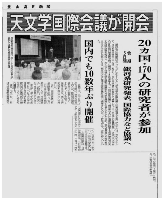
写真4 八重山毎日新聞の報道。