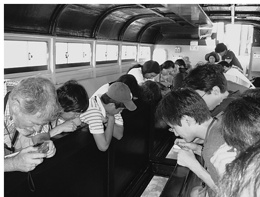
写真6 カピラ湾でのグラスボートからみるサンゴ礁と熱帯魚に興味津々の天文学者たち。

ではなくて、VERAだ。会議の趣旨からいっても、国立天文台VERA石垣観測所の見学ははずせない(写真5)。そのうえで、せっかくだから「ちゅら海」を見ない手はない。有名な景勝地川平湾もコースに入れた。ここではグラスボートで、貴重なさまざまな種類のサンゴや魚を観察してもらった(写真6)。地元のバス会社と相談して、何台かのバスで、いくつかの見学スポットを分散してまわることで、参加者が1カ所に集中しすぎないように工夫をした。昼食も美しいビーチを望むホテルの庭でビュッフェ形式でとってもらった。しかし、どんなに周到な準備をしても、天気が悪ければ台無しである。台風シーズンが終わることを見越しているとはいえ、実際にどうなるかは神のみぞ知る。幸い、参加者の日頃の行いがよかったのか、会期中は完璧な天気だった。その次の週には、台風が来て海は大荒れ。まさに間一髪。参加者は石垣島の自然とVERA観測所を多いに楽しんでくれたようだ。