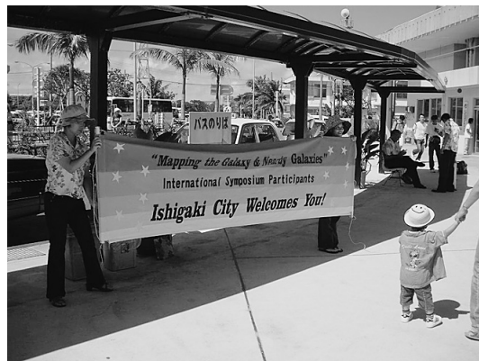
写真1 石垣市の歓迎横断幕（石垣空港）。

会期中、「マッピングってなんですか」と地元のタクシーの運転手さんにも聞かれたのだが（会場のホテルの玄関にはデカデカと横断幕が張ってあった）、確かに一般にはちょっと馴染みのない言葉かもしれない。ようするに「地図を描く」ように、銀河の星間ガスや星の空間、速度構造を明らかにすることだ。銀河、特に天の川銀河に代表されるような「渦巻き銀河」はとても複雑な構造をしている。近年は HST, Spitzer, Subaru などの観測装置の発展により、近傍銀河の詳細な構造も明らかになってきた。さらに、今後10年で、ALMA や JWST, SPICA といった大型観測装置によって、さらに詳細な構造が見えてくるだろう。