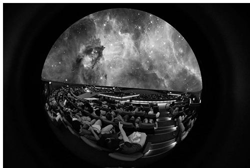
フルドームシステムの映像体験(合成)。