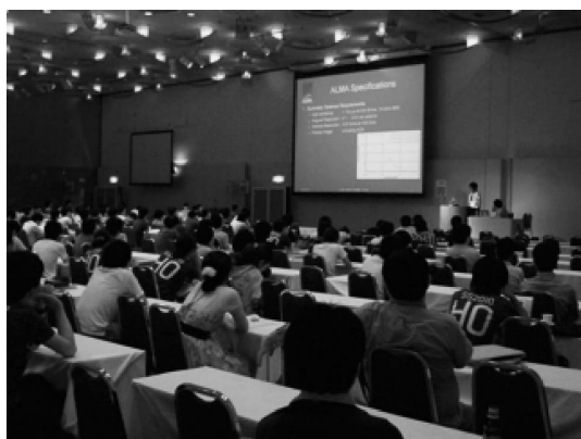
昨年度の全体企画会場の様子。