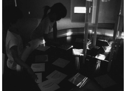
写真4 「光のテーブル」での体験。

ができ、さらに、長方形のステージの反対側にボールを落とすもう一つの穴（ゴール）が設けてあることです。ボールを打ち出す角度をさまざまに変化させることによって、ボールの運動も変化し、ブラックホールの周りでの光や物質の運動から、見えない「穴」の存在や、重力レンズの仕組みへと思考を進めることもできます。