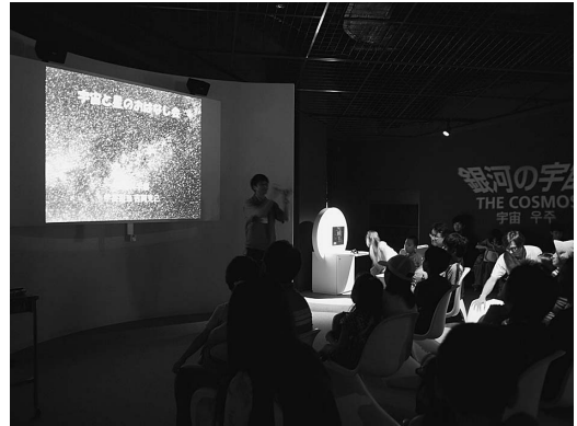
写真5 「おはなし会」でのコミュニケーション。

宇宙分野における生涯学習としてのアプローチにおいて、天体観察会や各種の講座、あるいはプラネタリウムが有効であることには多くの実践報告から明らかです。しかし、科学館施設は常設展示を中心に成り立っており、お客様の動員数もイベント参加者とは桁違いです。姫路科学館では、