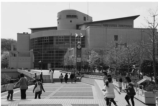
写真1 姫路科学館外観。