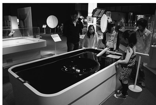
写真2 「ブラックホール」での実験体験。