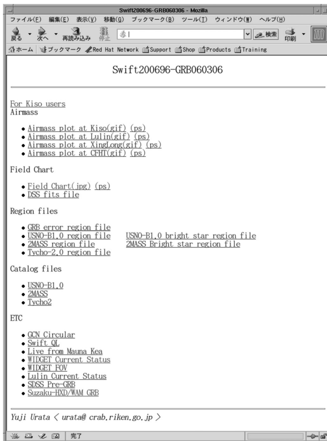
図3 新しいガンマ線バーストの発生速報を受けると自動的に観測/解析に必要な情報がチーム内閲覧専用のweb page に集約される。

や、衛星からの発生情報が本物のガンマ線バーストではなく、ほかの突発天体の場合もあります。これらのチェックをもとにすべての観測の方針が決まります。また、複数サイトと連携して観測する場合は、チーム内の迅速な意思疎通も不可欠な要素の一つですが、skypeなどのインターネット電話を活用することで解決しています。