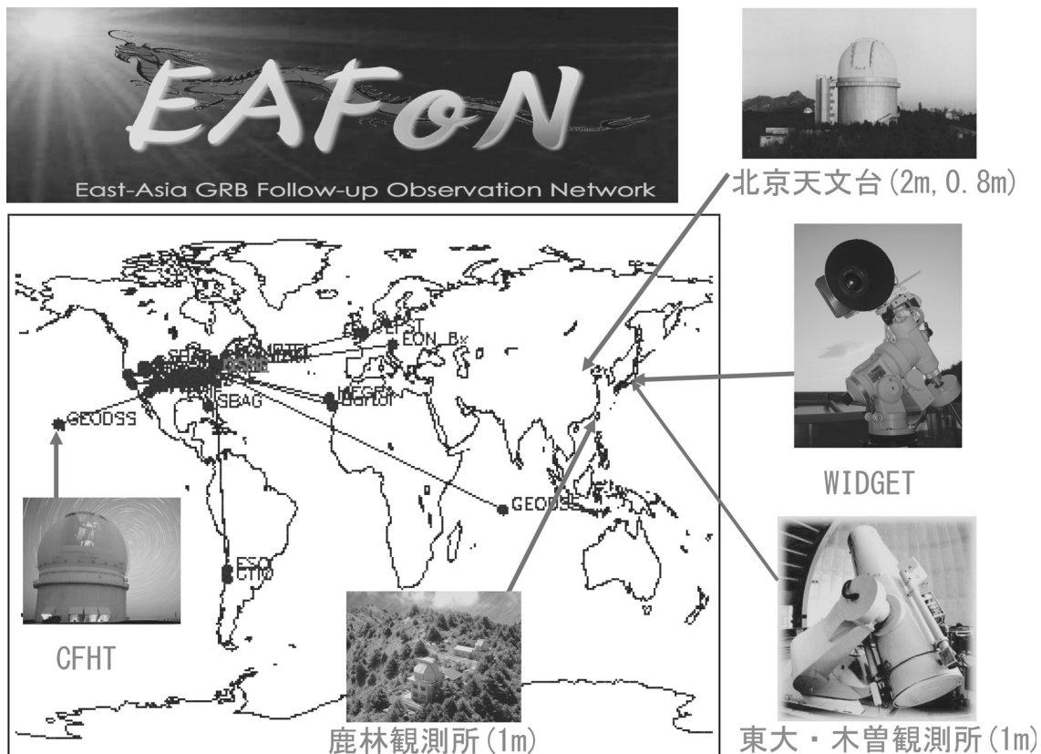
図1 EAFONの観測サイトマップ。3地域の1-2m級の望遠鏡、ハワイにある4m級の望遠鏡とガンマ線バーストの発生前から観測を行える超広視野カメラで構成される。GCNのweb pageにある追跡観測サイトの分布図にEAFONの観測サイトを重ねた。

少なくできています。さらにEAFONは、アメリカやヨーロッパでは強力なグループがあるなかで、国際競争力を与えてくれています。最近では、ハワイにある欧米の望遠鏡もこの連携に加えて追跡観測を実施しています。この結果、HETE-2打ち上げ直後の2001年初頭には、東アジア地域におけるガンマ線バーストの追跡ネットワークはほぼ皆無でしたが、EAFONによってこの空白を埋めることに成功しました 13) 。