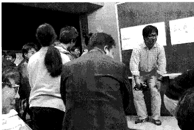
「クレーターを作る」実験を、身を乗り出して見つめる参加者のみなさん