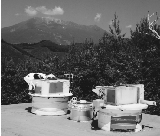
図1 夜天光観測装置。 左側から全天カメラ，大気光天頂測光器，夜 光分光器。