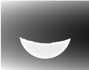
図2 月食の二値化画像

地球の影の中の明るさは、地球の大気の影響で緩やかに変化している。このため、上記の図1の作図法で月までの距離を測定するとき、地球の影の境界の位置の取り方で、月までの距離に大きな不定性が出てしまう。このため、月食の画像を二値化することで月の弧や地球の影の境界を任意に抽出するプログラムを作ることで、地球の影の様子を調べることにした。二値化とは、画像の輝度を閾値で分けて白と黒に変換する画像処理のことである。図2は、二値化した画像から、月の弧となる部分と地球の影の境界の弧となる部分の抽出した画像である。